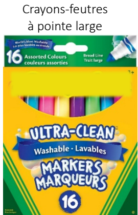
Crayons-feutres à pointe large