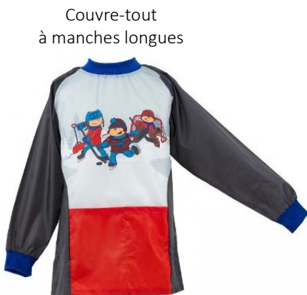
Couvre-tout à manches longues