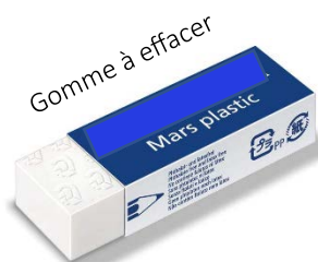
Gomme à effacer