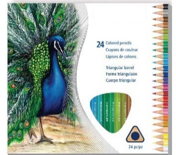
Crayon triangulaire en bois