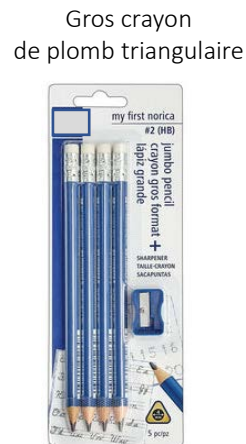
Gros crayon de plomb triangulaire