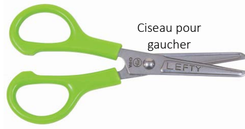
Ciseau pour gaucher