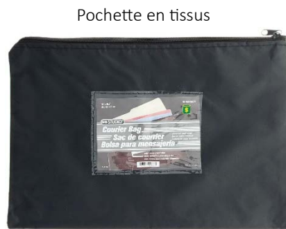
Pochette en tissu