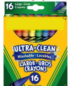
Crayon de cire « larges gros