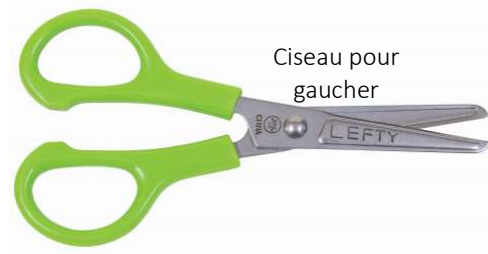
Ciseau pour gaucher